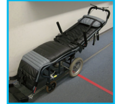
機内に入れる リクライニング 車いす