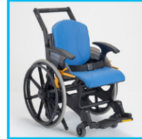
樹脂製 車いす (モルフ)