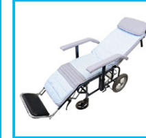
空港用 リクライニング 車いす