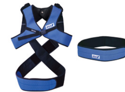
サポートベルト (ベストタイプ/ベルトタイプ)